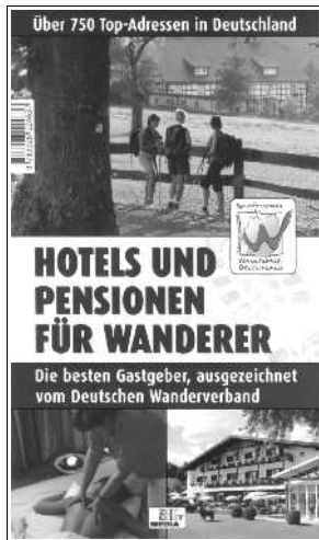
Buch „Qualitätsgastgeber Wanderbares Deutschland“ ZEITGEIST MEDIA, 2008 248 Seiten, Preis: 9,80 €