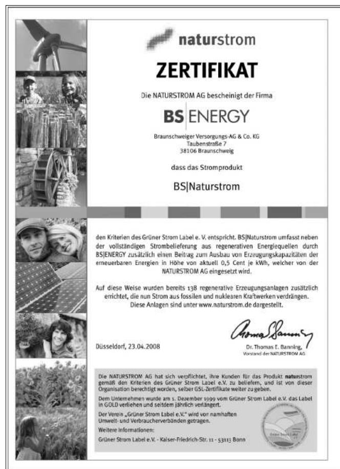
Zertifikat für BS|Naturstrom von BS|Energy

Der Firma BS|Energy wurde von der NATURSTROM AG für die Kunden mit dem folgenden Zertifikat bescheinigt, daß das Stromprodukt BS|Naturstrom den Grünen-Strom-Kriterien entspricht und zusätzlich ein Beitrag zum Ausbau der Ökostrom-Erzeugung von 0,5 Cent je kWh geleistet wird.