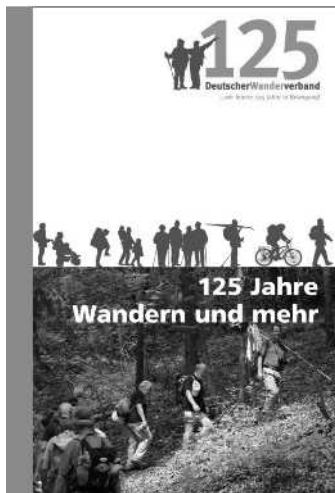
Jubiläumsbuch des Verbandes „125 Jahre wandern und mehr“ Deutscher Wanderverband, 2008 335 Seiten, Preis: 13,80 €