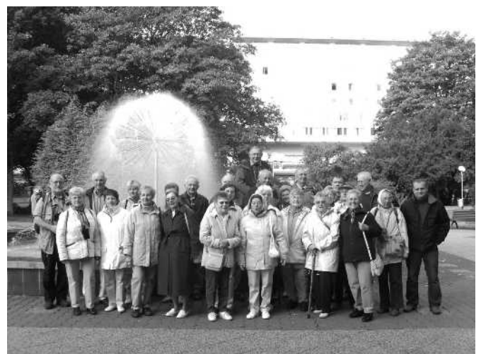
Unsere Reisegruppe des GGV im Stadtpark von Kolberg

Weitere Farbfotos von unseren Busreisen und einigen weiteren Veranstaltungen finden Sie im Internet unter: